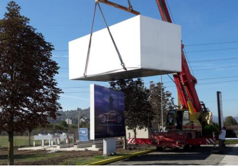
Dostava MDC 50KW na lokaciju.